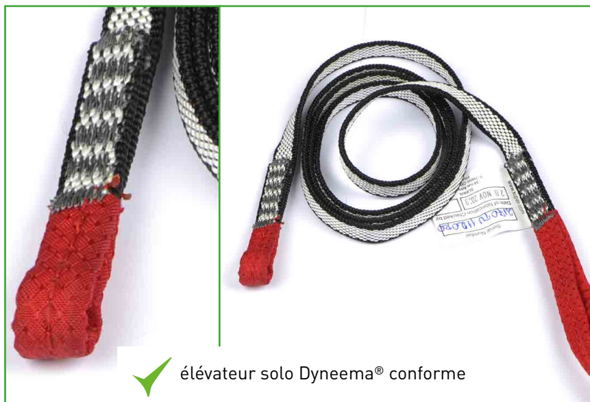
élévateur solo Dyneema® conforme

NB : il n'est pas nécessaire de déplier son parachute ni de défaire ses élévateurs de la sellette pour effectuer cette vérification.